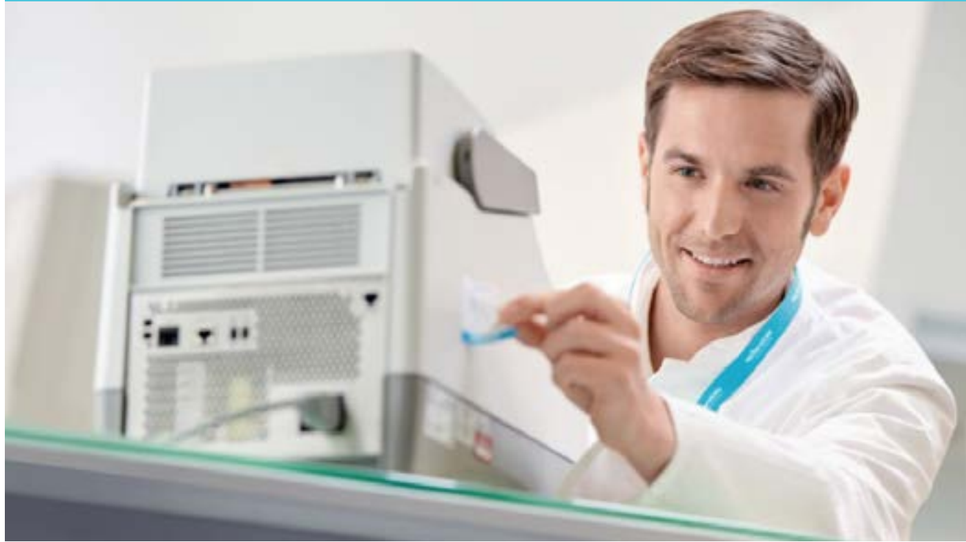
Eppendorf 종합 서비스 계약 및 보증 연장 (서비스 문의 T:1577-7167, service@eppendorf.kr)