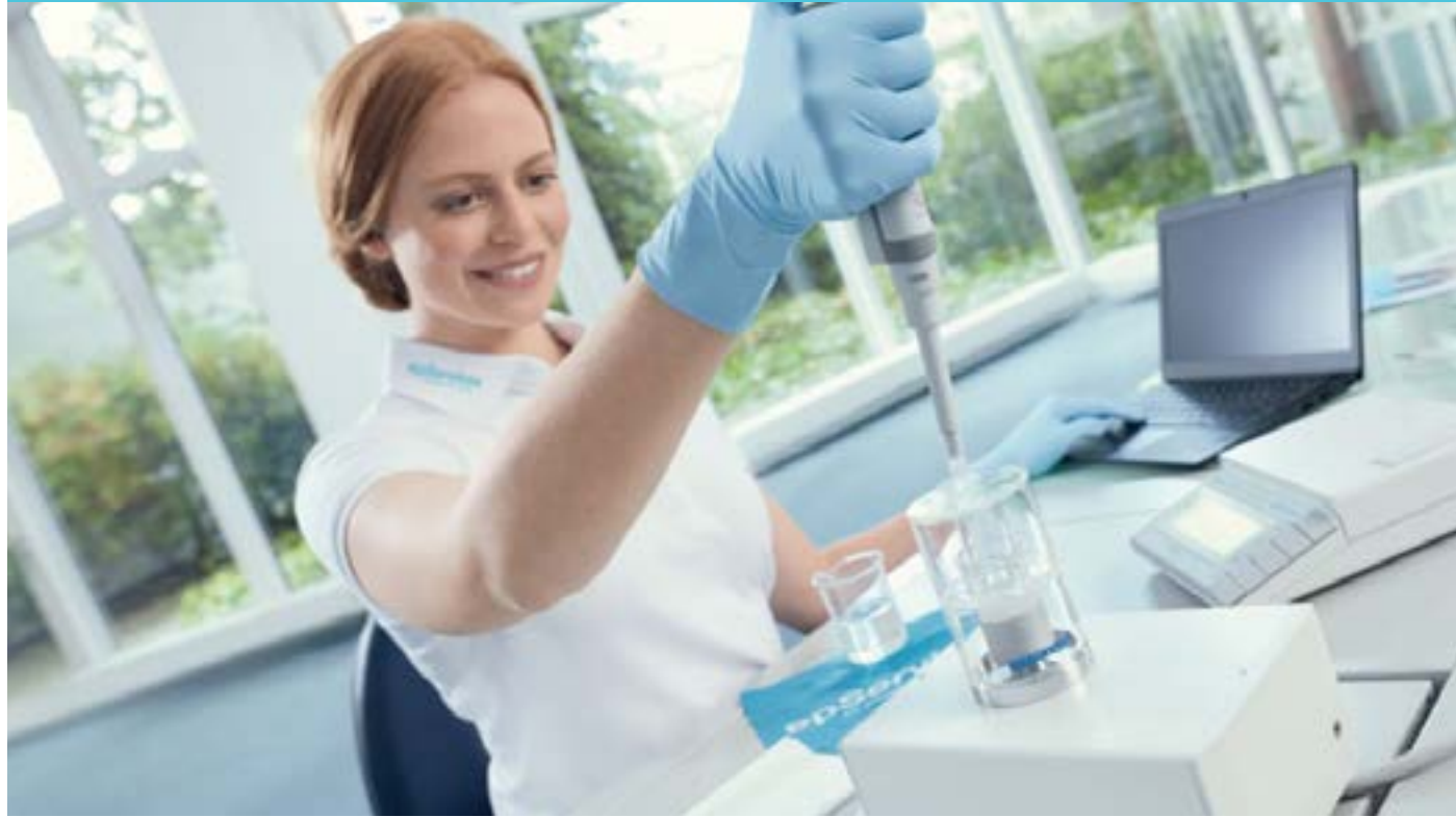
Eppendorf Korea 국제공인교정기관 KS Q ISO/IEC 17025 /KOLAS 인정 획득