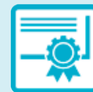
Qualification and Certification

Eppendorf 및 기타 브랜드 피펫에 대해 엄격하고 검증된 절차대로 진행합니다.